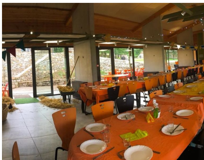
LA SALLE A MANGER